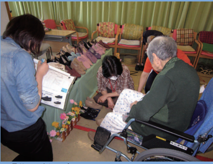
「靴が健康の要なのよ」