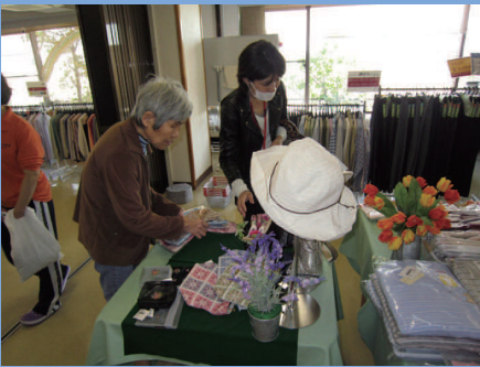
「あら、これもいいじゃない」