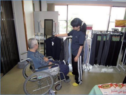
「ちょっと地味じゃない？」